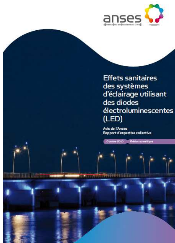
Illustration 13 : Effets sanitaires des systèmes d'éclairage utilisant des diodes électroluminescentes (Anses, Édition scientifique, oct. 2010)

polluants organiques persistants, les nanoparticules et les particules fines, etc.