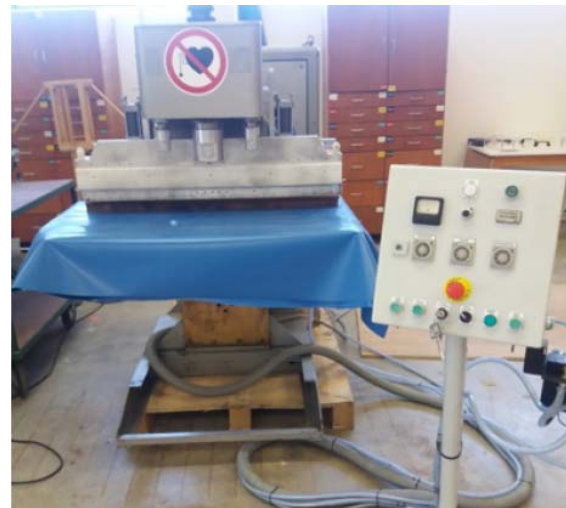
Illustration 7 : Presse haute fréquence utilisée pour les mesures

Une enquête réalisée à la demande de l'INRS 22 estime à environ 100.000 le nombre de ces équipements en France. L'analyse des mesures effectuées sur près de 1.000 postes de travail, à proximité de ces équipements, a montré des dépassements fréquents des VA préconisées par la Directive 2013/35/UE – ce qui implique de se référer aux VLE. C'est le cas notamment de la plupart des presses HF employées pour la soudure de grandes bâches. Néanmoins, ces résultats sont très dispersés car toutes ces machines industrielles sont de fonctions et de puissances très différentes, et l'exposition professionnelle qui en résulte est très variable.