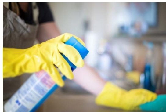
Illustration 5 : Les produits d'entretien sous forme de sprays

Les produits d'entretien contiennent de nombreuses substances irritantes (ex. ammoniac, eau de javel, solvants, acides dont détartrants 11 ) ou sensibilisantes (ex. limonènes 12 et autres parfums) qui peuvent provoquer de l'asthme selon des mécanismes encore peu connus. Bien que des associations aient été mises en évidence entre l'utilisation régulière de ces produits et l'apparition de l'asthme, les agents chimiques en cause n'ont pas été clairement identifiés. Or, la production de ces produits d'entretien sous forme de sprays a augmenté, depuis 2006, en Europe 13 alors que cette forme d'utilisation présente un risque élevé d'inhalation.