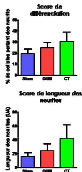
Fig. 2 Quantification de la poussée neuritique sous exposition (OMM), comparée aux contrôles (sham = sans exposition ; CT = contrôle thermique 38°C)

Les résultats obtenus au cours de ce projet sont très rassurants en ce qui concerne l'utilisation des OMM en télécommunication. En nous plaçant au-delà de la limite ICNIRP, nous n'avons pas observé d'effets significatifs sous exposition. Plusieurs paramètres ont été analysés, tels que l'expression d'une dizaine de protéines marqueurs de stress, de différenciation ou liées à la nociception 44 . Nous avons également analysé le métabolisme et le trafic de la dopamine, ainsi que la poussée neuritique. Pour ce dernier point, le nombre, la longueur et l'orientation des neurites dans le champ électromagnétique ont été examinés (Fig. 1 et 2). Quel que soit le test utilisé, nos résultats ont été négatifs. On peut toutefois souligner que quelques tendances ont été observées, mais le différentiel entre les contrôles et les cellules exposées est trop faible pour pouvoir être statistiquement relevant. De plus, les contrôles thermiques que nous avons effectués ont permis à chaque fois de mimer ces effets, ce qui indique qu'ils sont très certainement d'origine thermique.