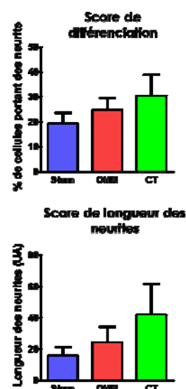
Fig. 2 Quantification de la poussée neuritique sous exposition (OMM), comparée aux contrôles (sham = sans exposition ; CT = contrôle thermique 38°C)

Les résultats obtenus au cours de ce projet sont très rassurants en ce qui concerne l'utilisation des OMM en télécommunication. En nous plaçant au-delà de la limite ICNIRP, nous n'avons pas observé d'effets significatifs sous exposition. Plusieurs paramètres ont été analysés, tels que l'expression d'une dizaine de protéines marqueurs de stress, de différenciation ou liées à la nociception 44 . Nous avons également analysé le métabolisme et le trafic de la dopamine, ainsi que la poussée neuritique. Pour ce dernier point, le nombre, la longueur et l'orientation des neurites dans le champ électromagnétique ont été examinés (Fig. 1 et 2). Quel que soit le test utilisé, nos résultats ont été négatifs. On peut toutefois souligner que quelques tendances ont été observées, mais le différentiel entre les contrôles et les cellules exposées est trop faible pour pouvoir être statistiquement relevant. De plus, les contrôles thermiques que nous avons effectués ont permis à chaque fois de mimer ces effets, ce qui indique qu'ils sont très certainement d'origine thermique.