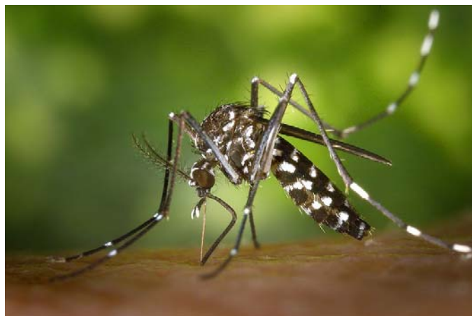
Moustique Aedes albopictus

La transmission du virus ne se fait pas d'homme à homme; elle nécessite la présence d'un moustique vecteur de l'espèce Aedes albopictus . Ce dernier, reconnaissable à cause de sa silhouette noire à rayures blanches, est aussi surnommé moustique « tigre ».