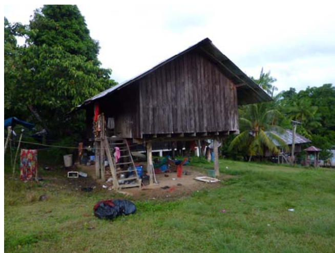
Habitation Wayampi traditionnelle à Trois-Sauts Plusieurs espèces de rongeurs et d'opossums viennent se nourrir sous et dans les maisons.

Outre les amérindiens, une petite dizaine d'expatriés vivent à Trois-Sauts. Depuis une quinzaine d'années, ils assurent l'éducation primaire de tous les enfants, et un service infirmier continu, au sein d'un dispensaire bien équipé. L'ensemble des soins et traitements sont dispensés de façon totalement gratuite ; ils sont inscrits sur des carnets de santé individuels, carnets qui sont conservés au sein du dispensaire.