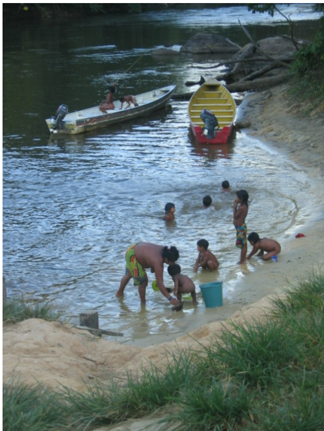
Le fleuve Oyapock est une composante essentielle de la vie au village de Trois-Sauts

coli 64 et Staphylococcus aureus 65 présentes dans les échantillons et leur évolution au cours du temps. Par ailleurs, il s'agissait d'étudier la dissémination dans l'environnement des gènes de résistance. Des selles de rongeurs domestiques et sauvages ont été récupérées après piégeage à des distances variant de 0 à 3000 m du village. De même, des prélèvements de sol et de la rivière qui baigne le village ont été réalisés.